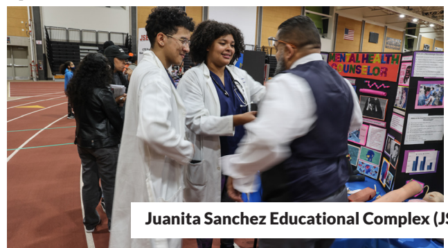
Juanita Sanchez Educational Complex (JSEC)

Um grande “obrigado” a todos que compareceram à Feira de Escolha Escolar! Ficamos muito entusiasmados em ver nossas famílias e compartilhar informações sobre as opções escolares para o próximo ano! Nossas escolas trabalharam com força total para mostrar às nossas famílias o que elas têm a oferecer aos alunos. Obrigado a todos que tornaram essa noite possível!