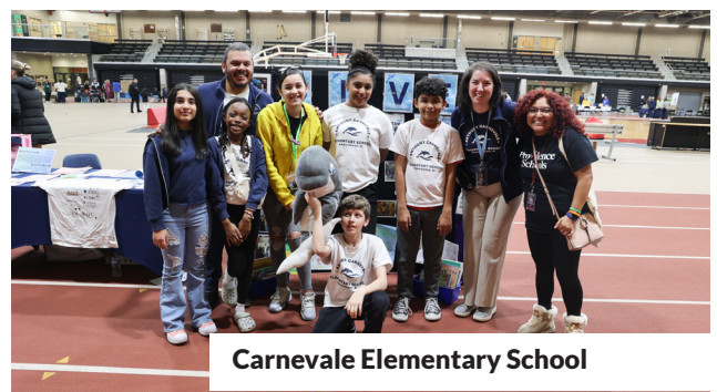
Carnevale Elementary School